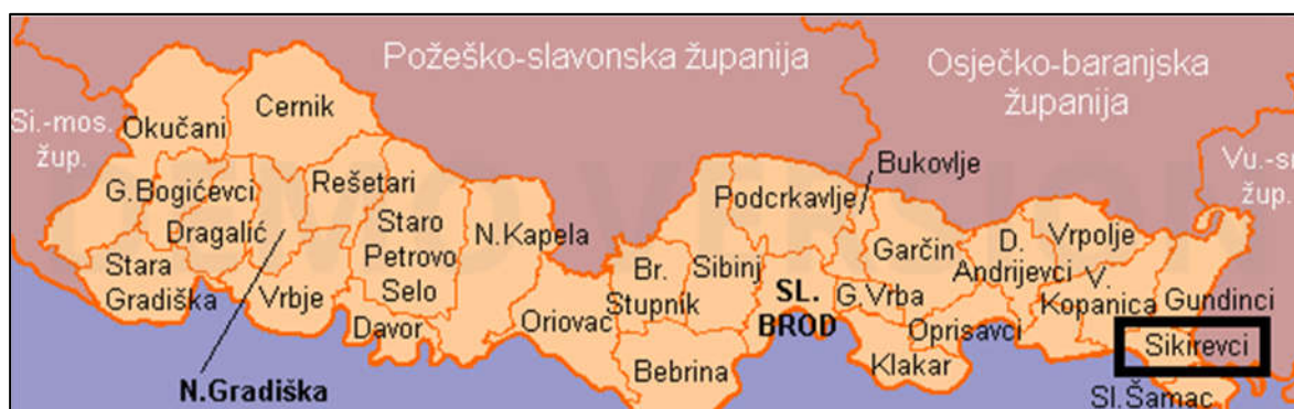
Slika 1: Administrativne granice Općine Sikirevci unutar Brodsko-posavske županije (Izvor: www.mup.hr )

Općina Sikirevci je smještena u Brodsko – posavskoj županiji u krajnjem jugoistočnom djelu. Smještena je između autoceste Zagreb- Lipovac i rijeke Save, na regionalnoj cesti Osijek – BiH. Neposredna blizina graničnog prijelaza u Slavskom Šamcu i dobar prometni položaj na prometnom križanju autoceste i ceste za Osijek te sama autocesta, daju dobre mogućnosti za prostorni i ukupni razvoj Općine. Općina Sikirevci je jedna od pograničnih općina. U županiji graniči sa općinom Oprisavci, Velika Kapanica, Gundinci i Slavonski Šamac. Na istočnoj strani ima granicu sa općinom Babina Greda u Vukovarsko – srijemskoj županiji. Klimatske osobine prostora Općine odlikuje homogenost klimatskih prilika što je odlika umjereno kontinentalne klime koja prevladava na širem području. Područjem Općine Sikirevci prolazi autocesta D4, državna cesta D7 i županijske ceste Ž4210 i Ž 4220. (Izvor: www.opcina-sikirevci.hr )