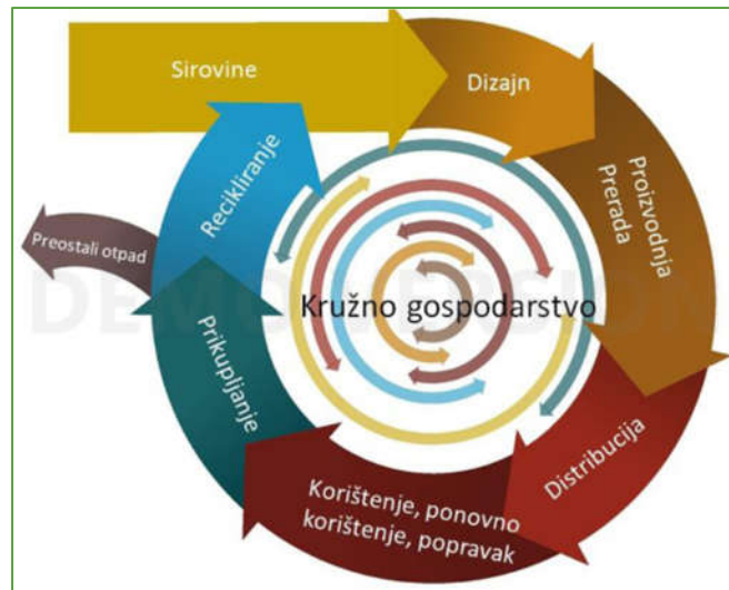
Slika 4: Model kružnog gospodarstva (Izvor: Plan gospodarenja otpadom RH 2017.-2022.godine)

Za prelazak na kružno gospodarstvo potrebne su promjene u cijelom lancu vrijednosti, od učinkovitog upravljanja resursima, dizajna proizvoda, novih poslovnih i tržišnih modela, novih načina pretvaranja otpada u resurse do novih modela ponašanja potrošača.