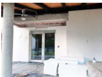
Neki od uspješno odrađenih poslova