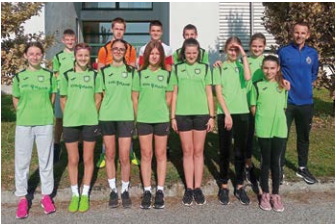
Predstavnici OŠ Sikirevci na natjecanju u krosu