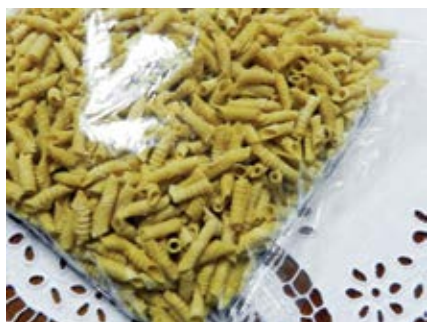
Slavni sikirevački „crvići“ su najtraženiji