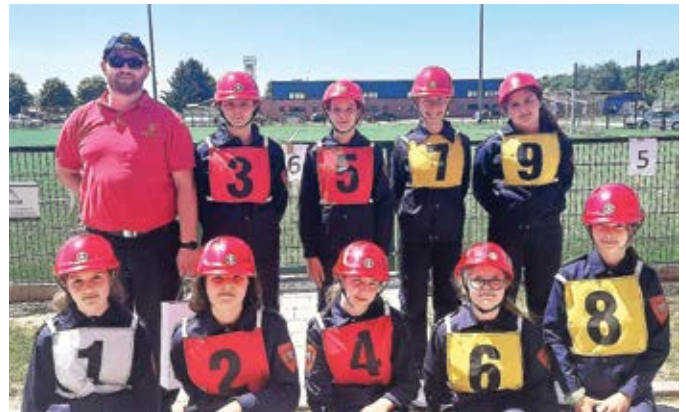
Ekipa juniora na državnom natjecanju u Čakovcu

Ženska ekipa juniora nastupila je na Memorijalnom kupu „Ivan Spajić“ u Vrpolju, a muška i ženska ekipa u Beravcima. DVD Sikirevci sudjelovao je i na natjecanjima u Marijancima, Bodo-