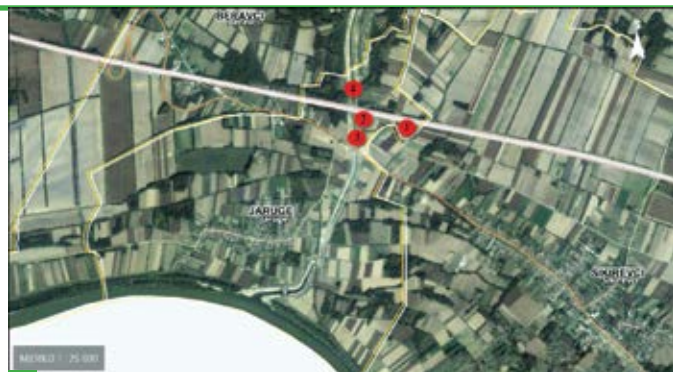
Pozicije do sada poznatih najznačajnijih prapovijesnih arheoloških lokaliteta. 1: Jaruge-Gođevo-Berava; 2: Jaruge-Gođevo; 3: Jaruge-Krnjice 1; 4: Jaruge-Gođevo 2.

U naselju starčevačke kulture na lokalitetu Jaruge - Gođevo pronađena su i dva ljudska ukopa u zgrčenom položaju tijela, postavljena na boku - što je uobičajen način pokopavanja u mlađem kamenom dobu. Ukop djeteta pronađen je na dnu jedne od poluzemunica, a