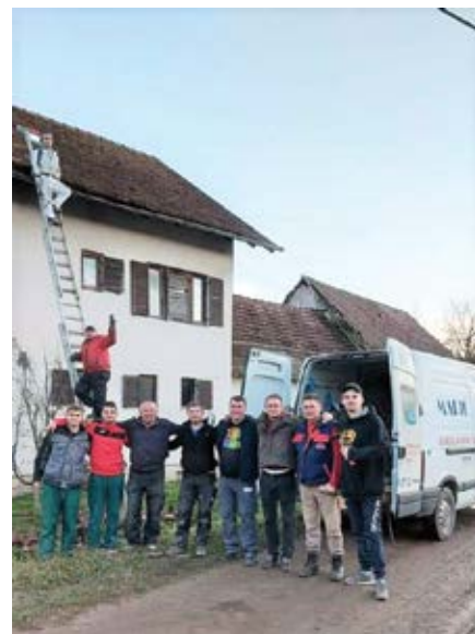
S ekipom Sikirevčana u pomoći Petrinji