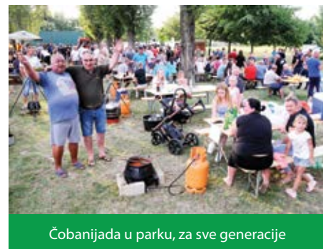
Čobanijada u parku, za sve generacije