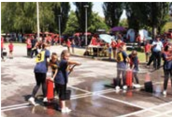
Natjecanje juniora u Sikirevcima

Natjecateljski duh snažno je izražen među članovima DVD-a Sikirevci. Krajem svibnja ženska mladež nastupila na XIII. memorijalnom kupu „Goran Trupina“ u Novoj Gradiški, dok se ekipa mladeži na-