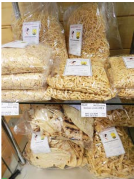
Domaća tjestenina odlično se prodaje preko „Sikirevčanke“