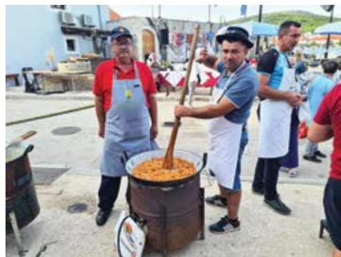
Topljenje čvaraka, prava atrakcija