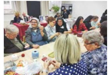
Radionica izrade sunčane čipke-motiva, prilika je i drugim čipkaricama da nauče motivati uz iskusne sikirevačke motivale

stavljena je u subotu i nedjelju uz brojne posjetitelje, radionicu motiviranja, misno slavlje, nastup pjevačke skupine HORKUD „Golub“ i neizmerno mnogo novih upletenih niti obogaćenih prijateljskim stvima.