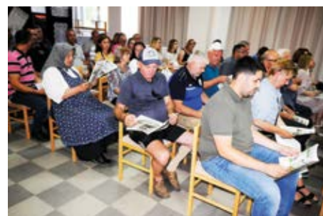
Novi broj Vjesnika općine Sikirevci sa zanimanjem se prelistavao