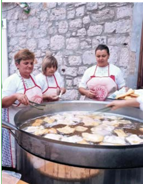
Vruće lepinje na svinjskoj masti