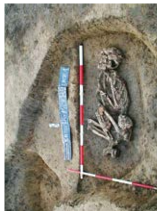
Skeletni ljudski ukop muškarca iz mlađeg kamenog doba s lokaliteta Jaruge-Gođevo