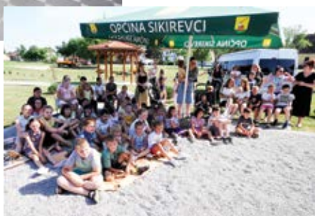
Kazališna predstava na otvorenom - mališani u publici bili su oduševljeni

Popodne je u središtu naselja bilo kao u košnici, uživale su sve generacije mještana