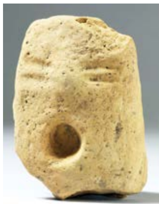
Figurica s ljudskim licem iz vremena starčevačke kulture s lokaliteta Jaruge-Gođevo