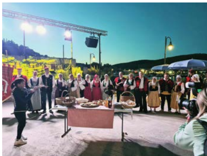
Dalmatinska večer, nastup KUD-a iz Tribunja

Svi su bili iznimno zadovoljni manifestacijom i odmah najavili da će ju nastaviti i dogodine, ali prije početka turističke sezone Sikirevčani očekuju posjet prijatelja iz Tribunja.