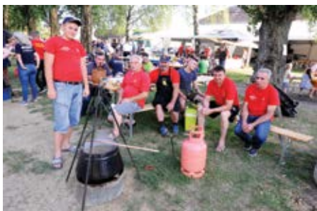
Tko će skuhati najbolji čobanac?