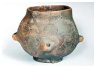
Keramički lonac starčevačke kulture s lokaliteta Jaruge-Gođevo

denom antropološkom analizom skeletnih ostataka odrasle osobe utvrđeno je da pripada muškarcu, tjelesne visine od 170 cm te starosnog raspona između 35 i 45, najvjerojatnije oko 40 godina. Bio je položen na desni bok, s rukama privučenima glavi te licem okrenutim prema istoku. Uz pokojnika je pronađeno nekoliko ulomaka keramičke posude u funkciji grobnog priloga. Nakon starčevačke, uslijedila je sopotska kultura, koja je predstavnik klasične zemljoradničke privrede, a njeni nositelji započinju izgradnju nadzemnih stambenih objekata pravokutnog oblika s krovom na dvije vode.