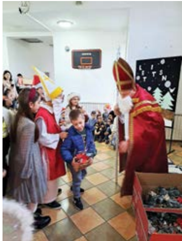
Darovi ipak nisu izostali