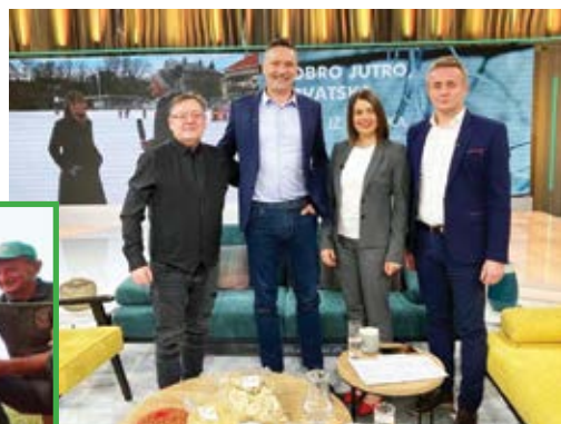
U studiju HTV-a