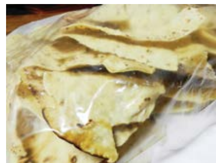
Mlinci su pečeni na ploči štednjaka