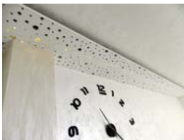
Detalj iz dnevnog boravka najbolja mu je reklama