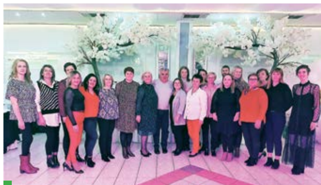
Obitelj i djelatnici Vuković centra na proslavi 25. godišnjice

Trenutačno se bore s još jednim problemom, neloyalnom konkurencijom koju svima u ovom poslu, možda i nehotice, stvaraju općine. Naime, u većini su sela sada lijepo uređene dvorane društvenih domova koje se najviše koriste upravo kao svečane dvorane. Cijena iznajmljivanja je nikakva, često ne pokriva ni osnovne troškove struje, vode, grijanja, hlađenja, čišćenja. - Problem je što nismo u istom pravnom statusu. To je javni prostor u kojemu se krše pravila kojih se mi pridržavamo, od HC-CAP-a, sanitarnih propisa, troška zaposlenika... Predložili smo da se uvede kontrola i da općine taj prostor iznajmljuju samo onima koji im donesu ugovor o cateringu s registriranim ugostiteljem. Time bi se uredilo tržište, a onda ćemo se mi ugostitelji međusobno nadmetati svojom kvalitetom i ponudom. - Ali prebrodit ćemo i to. Žilavi smo, da nije tako ne bismo opstali 25 godina – kaže u Vuković centru u Sikirevcima.