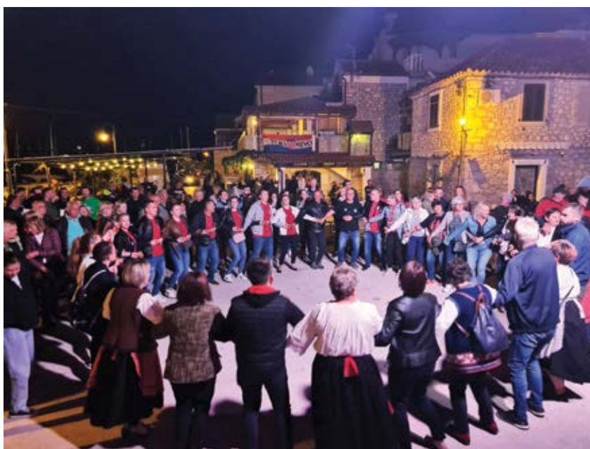
Program je završio slavonskim kolom