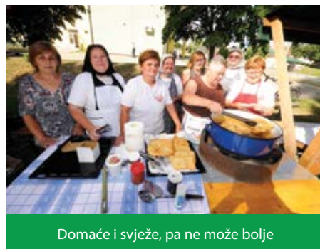
Domaće i svježe, pa ne može bolje