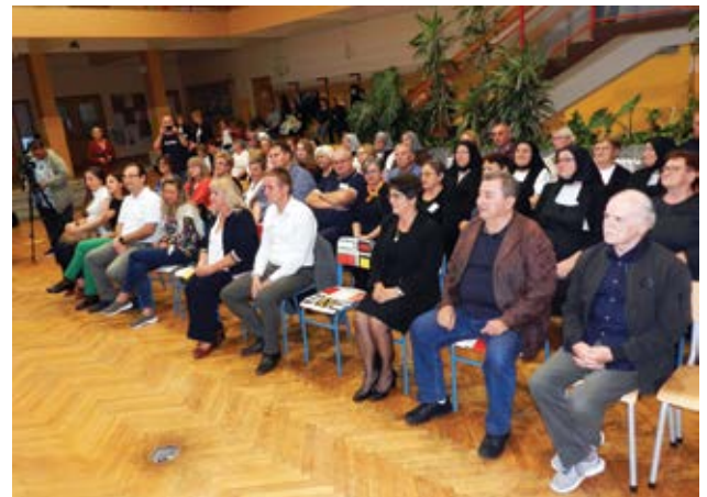
Sudionici, uzvanici, gosti i domaćini na otvorenju šeste Izložbe čipke