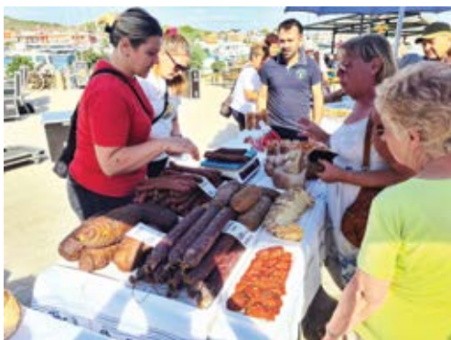
Veliko zanimanje za sikirevačke suhomesnate proizvode