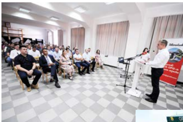
Svečana sjednica Općinskog vijeća

postrojbe koja je tijekom 1992. godine bila na položajima na području općine Sikirevci. Nekadašnji ratnici prisjetili su se dana ponosa i slave, kada su im tamošnji stanovnici bili odlični domaćini, a i sada su ih, nakon tri desetljeća, u miru, sjajno ugostili.