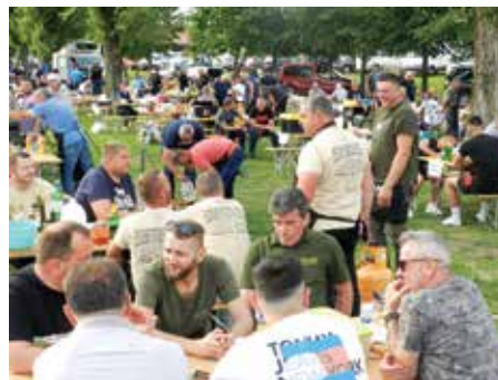
Ekipe stige sa svih strana