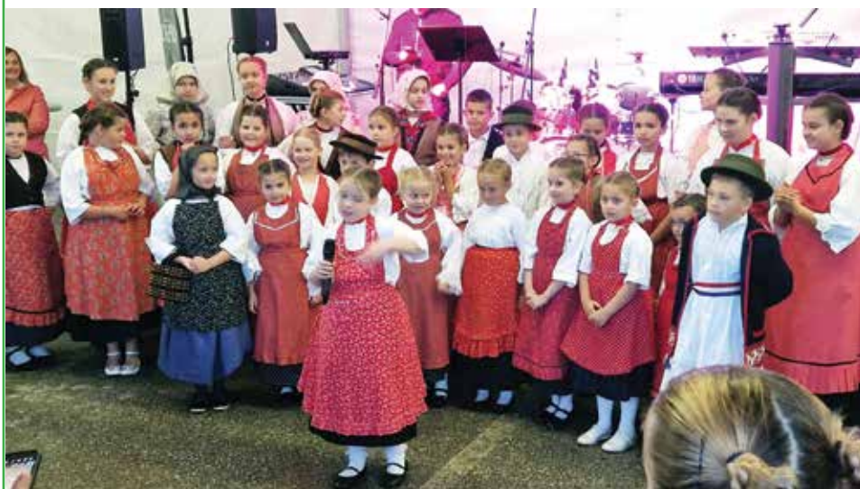
Najmlađi i najslađi sudionici programa, učenici OŠ „Sikirevci“ i članovi KUD-a „Sloga“

Manifestacija je tako postigla cilj i učvrstila prijateljstva te povezala Slavoniju i Dalmaciju, tamburicu i mandolinu, Sikirevce i Tribunjce, koje očekuje „uzvratni meč“ koncem ljeta u Tribunju. U međuvremenu, neki će godišnji odmor provesti u Tribunju, a neki će Tribunjcima poslati svoje domaće proizvode, kako za domaćine tako i za turiste.