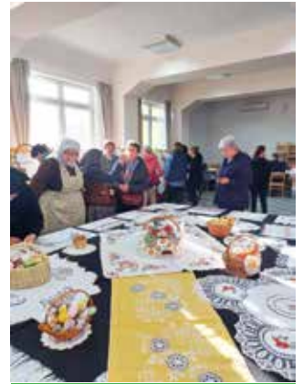
Uskrsna izložba uvijek privuče pozornost televizije

Osim toga, motivale su i ove godine pred Uskrs, na Cvjetnu nedjelju, priredili svoju tradicionalnu uskrsnu izložbu. U prvom su planu bile salvetice za prekrivanje uskrsnoga jela koje se nosi na blagoslov, ali tu su se našli i brojni drugi ručni radovi kojima vrijedne Sikirevčanke ukrašavaju domove u