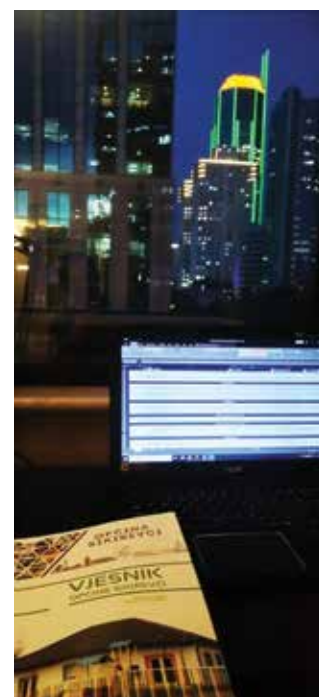
Rad na „Sikirevačkom vjesniku“ u Šangaju