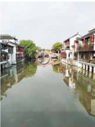
Qibao - vodeni grad