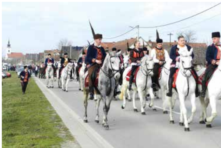
Preko stotinu pokladnih jahača na 31. pokladnom jahanju u Sikirevcima

Konjogojskoj udruzi „Sikirevci“ u organizaciji pomaže Općina Sikirevci, Dobrovoljno vatrogasno društvo koje osigurava da se sve odvija u redu, KUD „Sloga“ koji program redovito obogati pjesmom, ali i svi drugi mještani. Zato sikirevačko pokladno jahanje i traje 31 godinu, a ove, čini se, bilo je i jedno od najbrojnijih, jer je okupilo 105 konja i jahača iz gotovo cijele Slavonije. I svi s osmijehom na licu, pjesmom na usnama, spremljeni u tradicijsko ruho, na konjima urednim, istimarenim, dobro dresiranim. Zar može ljepše. Osim, ako nije, kao u bušarcu koji su zapjevale članice KUD-a: „Sikirevci, puni ko-