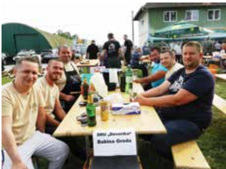
Babogredska ekipa pripremila je ove godine najbolji fiš