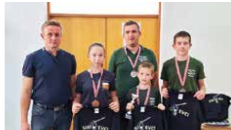
Kadeti, treći na županijskom natjecanju