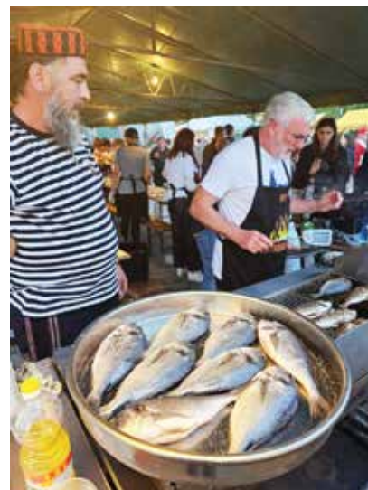
Svježu jadransku ribu pripremali su Tribunjci