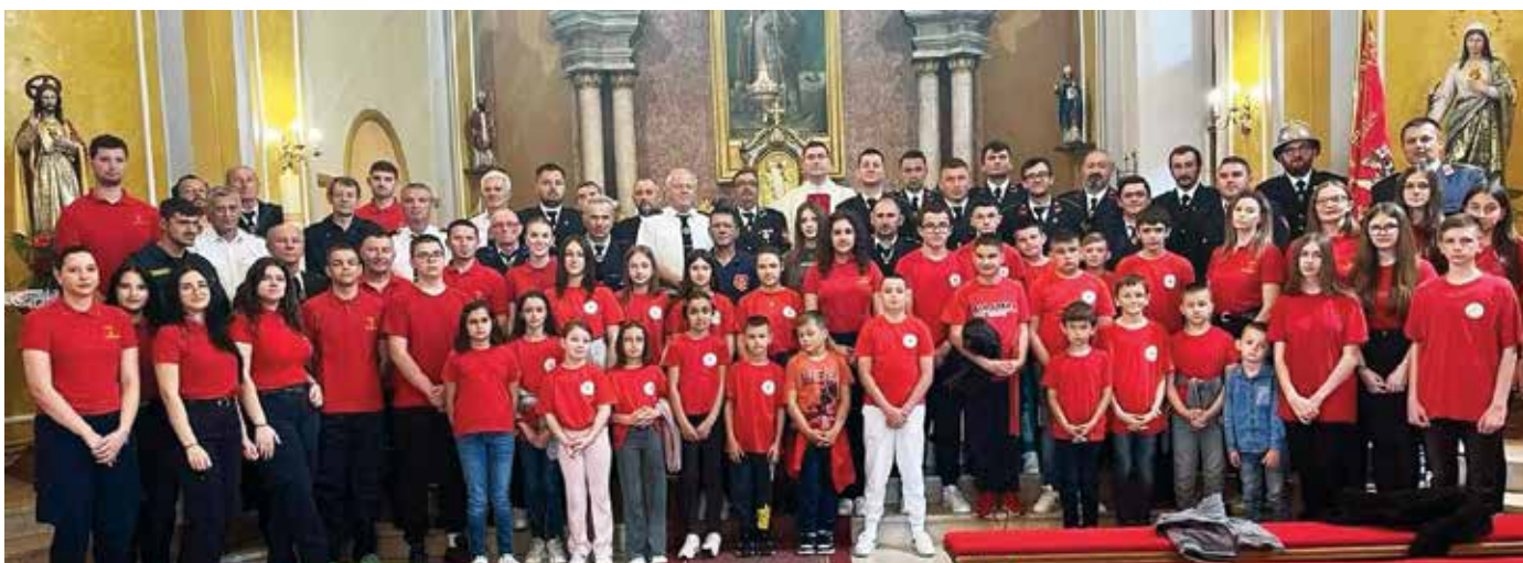
Na blagdan sv. Florijana, zaštitnika vatrogasaca, članovi DVD-a Sikirevci okupili su se te tradicionalno sudjelovali na misi, a potom zajedništvo nastavili uz objed u prostorijama društva

U Sikirevcima je 9. prosinca 2023. održan VIII. zimski kup u spajanju usisnog voda. Natjecanje je okupilo 22 ekipe seniora. Organizatori su se, kao i svaki put dosad, pobrinuli da sudionici ne ostanu gladni. Druženje prijateljskih društava nastavilo se i nakon natjecanja.