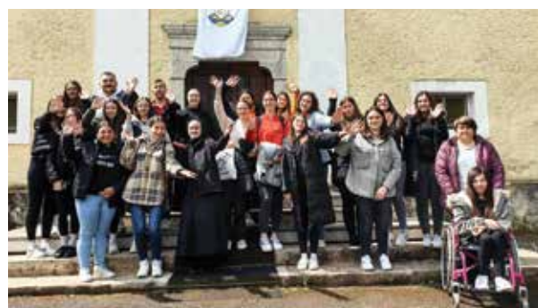
Mladi iz župe Sikirevci sudjelovali su i na XII. Susretu hrvatske katoličke mladeži u Gospiću