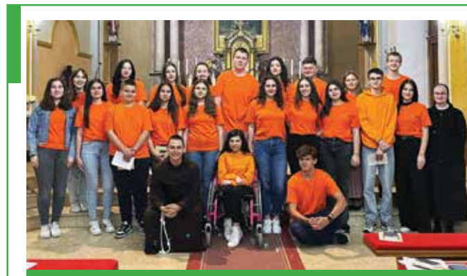
Sredinom svibnja dvadeset je mladih iz župe sv. Nikole Biskupa primljeno u bratstvo Franjevačke mladeži