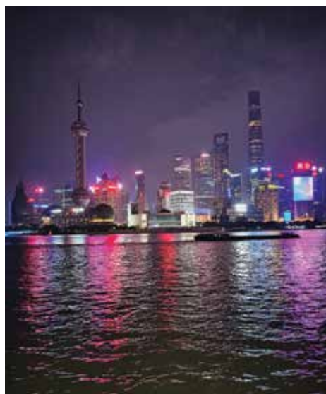
Pogled s Bunda na istočnu obalu rijeke

Povijest i kultura – Na jednoj poslovnoj večeri kolega sa Sveučilišta u Šangaju rekao je: „Ako želiš vidjeti povijest Kine unazad 40 godina, odi u Chongqing. Želiš li otkriti razvoj gradova i ekonomije, Šangaj je pravo mjesto. Zanima li te povijest unazad 400-500 godina, svakako posjeti Peking i Nanjing, a ako želiš zaviriti u povijest nekoliko tisuća godina, onda moraš posjetiti Xi'an.“ Kina je teritorijalno malo manja od cijele Europe i nemoguće je u mjesec dana obići sve što čovjek želi vidjeti u Šangaju i okolici, a još manje u cijeloj Kini. Muzeji koje sam posjetio nude pregršt zanimljivih izložaka iz povijesti, tradicije, etnografije,