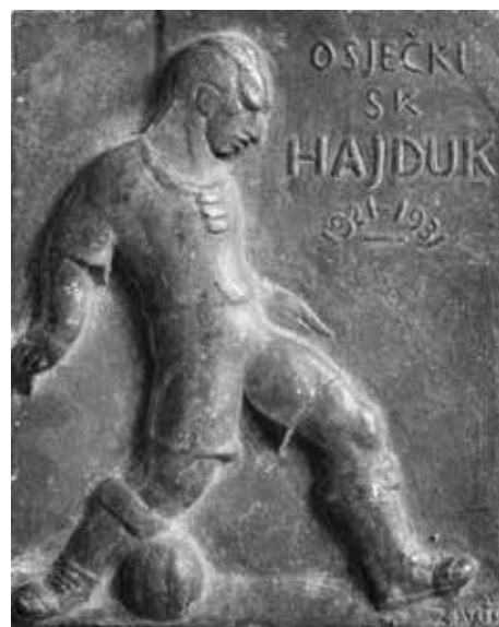
Medalja Osječki SK Hajduk (1931., Gradski muzej Vukovar)