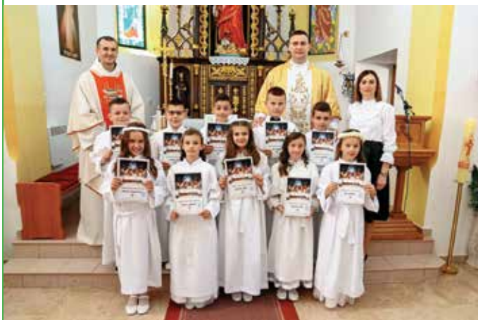
Prvopričesnici u Jarugama