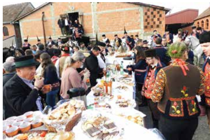
Ima li veće ljepote i ponosa