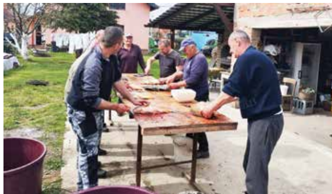
Čišćenje i priprema ribe posao je za ekipu dan ranije

te „Slavonsku večer“ prilikom posjeta gostiju iz Tribunja (koje su pogostili i dobrom slavonskom pečenkom), a uvelike su pomogli i UHBOS u organizaciji prve Braniteljske fišijade. Pravi su majstori u pripremi ribljih specijaliteta, pa uz njih nitko ne ostaje gladan, a na Braniteljskoj fišijadi su to i potvrdili osvojivši četvrto mjesto među 32 natjecateljske ekipe.