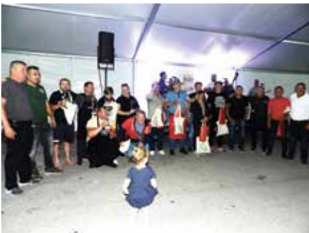
Sve nagrađene ekipe i domaćini prve Braniteljske fišijade u Sikirevcima