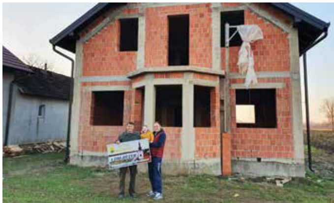
Obitelj Pavlović – izgradnja obiteljske kuće