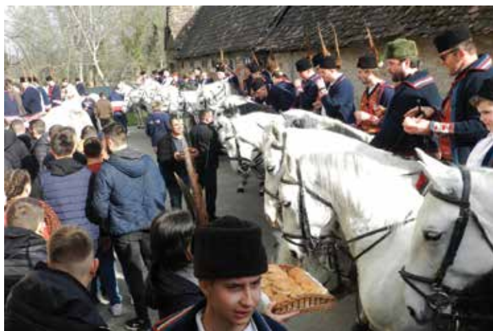
Domaćini su pogostili i sudionike i pratnju i promatrače