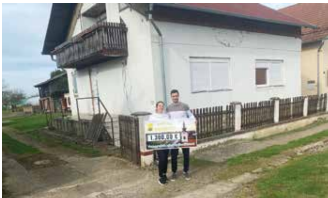
Obitelj Popović – kupnja obiteljske kuće

poticaja, nastavila je dodjeljivati potpore mladim obiteljima i poduzetnicima koji se odluče