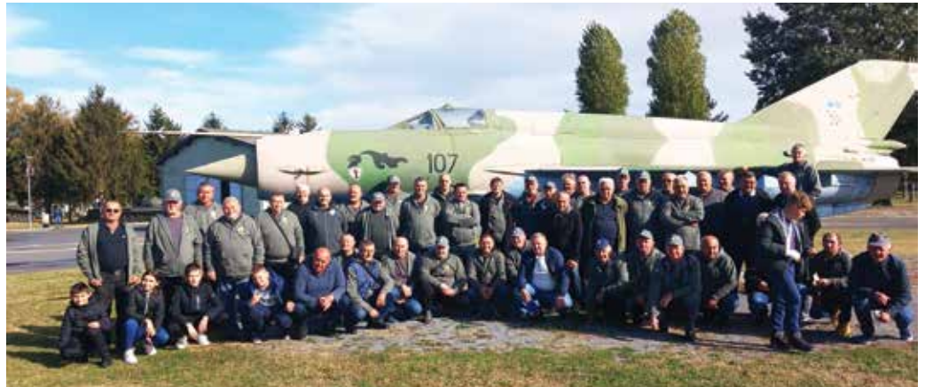
Članovi Udruge hrvatskih branitelja općine Sikirevci u Muzeju Domovinskog rata u Vukovaru

- Naša udruga okuplja sve branitelje s područja općine Sikirevci, neovisno o postrojbama u kojima su bili, gdje su i koli-