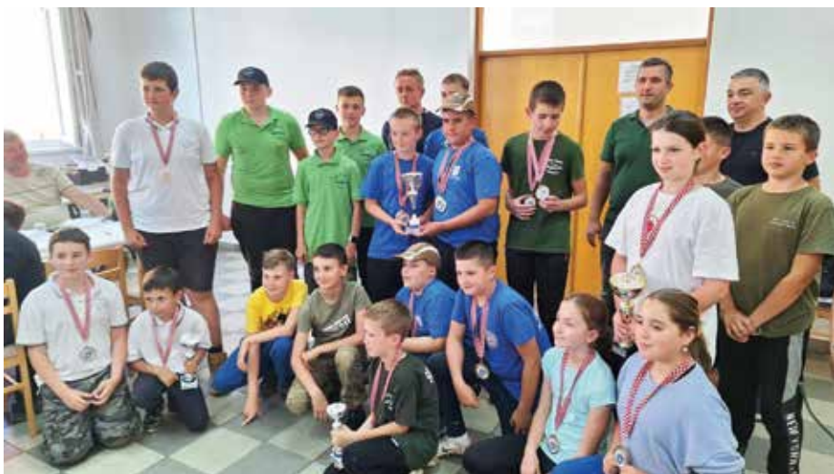
Ekipa ŠRD „Smuč“, organizatori i natjecatelji