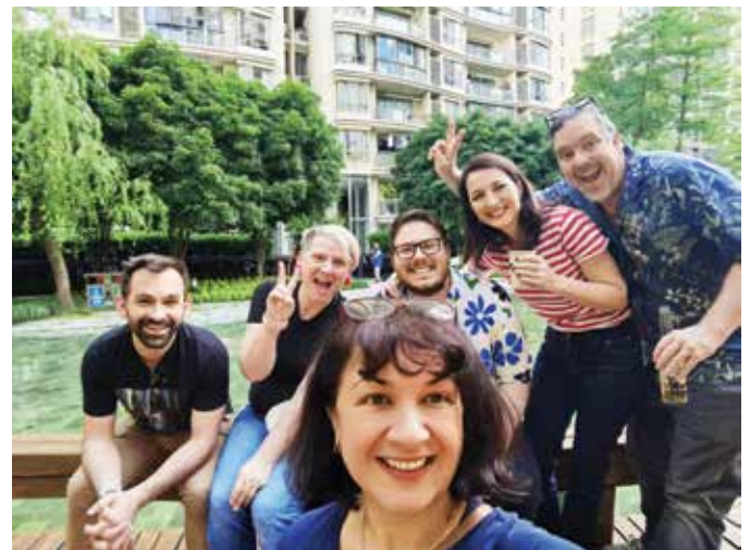
Ekipe Hrvata na roštilju za 1.5