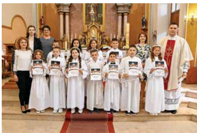
Prvopričesnici u Sikirevcima

Nekoliko dana pred izlazak ovog broja „Sikirevačkog vjesnika“, 1. lipnja 2024., u župi je održano još jedno veliko slavlje, podjela sakramenta svete potvrde. U ime nadbiskupa Đure i