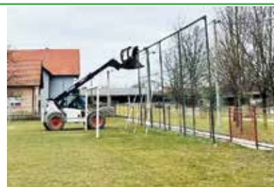
Nove mreže donirala je tvrtka Eding d. o. o. za građenje i opremanje objekata