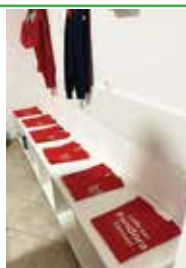
Zahvaljujući Caffè baru „Pandora“ klub ima i nove majice

hvaljuju i svim sponzorima koji donacijama podupiru rad kluba i olakšavaju njegovo svakodnevno funkcioniranje.