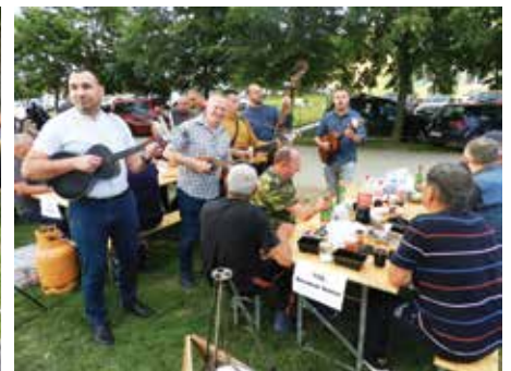
Cijelo vrijeme odlična atmosfera uz prijatelje i tamburaše