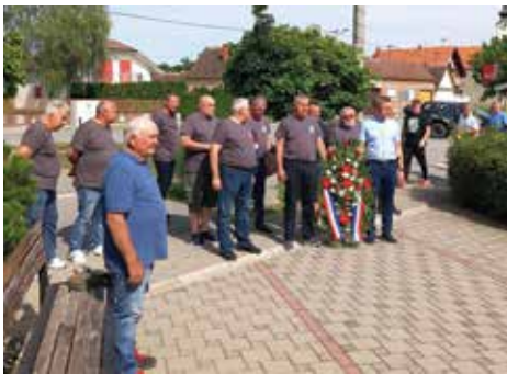
Svaki je događaj, pa i okupljanje na Braniteljskoj fišijadi, prilika da se oda počast poginulima

ga imaju prekrasne i vrijedne kolekcije iz rata koje povremeno izlažu. Udruga je lani obnovila dva spomenika poginulim braniteljima, u Jarugama i Sikirevcima, gdje polažu vijence i pale svijeće u prigodama godišnjica pogibije branitelja ili većih blagdana, organizirano