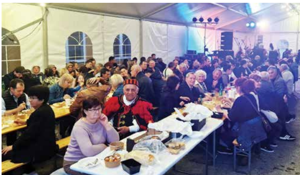
Kod punih stolova i uz dobru glazbu, što treba više za dobro raspoloženje

„Drugo poluvrijeme“, u subotu, kada su se kuhače i pozornice prihvatili gosti iz Dalmacije, bilo je još zanimljivije i posječeno iznad svih očekivanja. Ta nije to svaki dan da se u Slavoniji peče i kuha morska riba zalivena maslinovim uljem, toči dalmatinsko vino, narezuje pršut i ovčji sir, a sladi fritulama i to uz pravu dalmatinsku pjesmu za koju su se pobrinuli klapa „Sebenico“ te