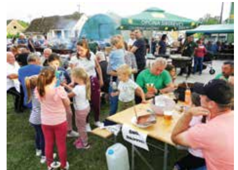
Na natjecanje su se odazvale i druge sikirevačke udruge, pa je bilo i puno djece