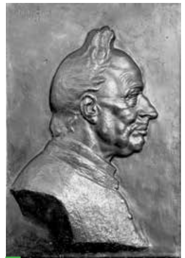
Portret J. J. Strossmayera (1928., Muzej likovnih umjetnosti, Osijek)