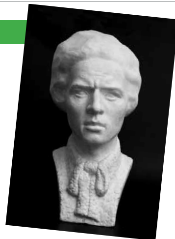
Autoportret (1923., Muzej likovnih umjetnosti, Osijek)

atentata na Radića i zastupnike HSS-a u beogradskoj skupštini, radi čega ga je policija dvaput zatvarala.