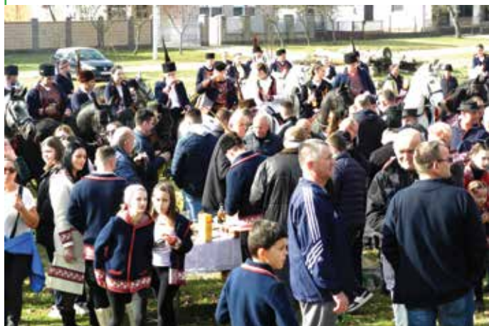
Stotinu konja, stotinu jahača i gotovo isto toliko gostiju domaćini su primali u svoja dvorišta i častili jelom i pilom