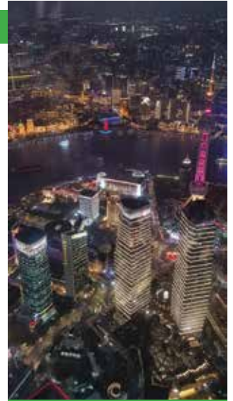
Pogleda sa Shanghai Towera

arheologije, kaligrafije do moderne umjetnosti.