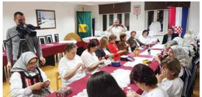
Snimanje emisije Osječke televizije

danima Uskrsa. Tijekom popodneva izložbu su obišli brojni mještani uživajući u ovom prikazu tradicije i umijeća.